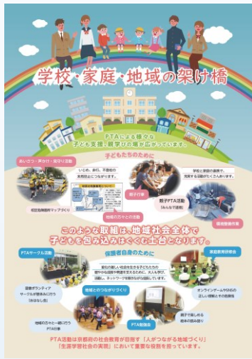
家庭・家庭・地域の架け橋