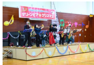
ジャンプリングオレンジ