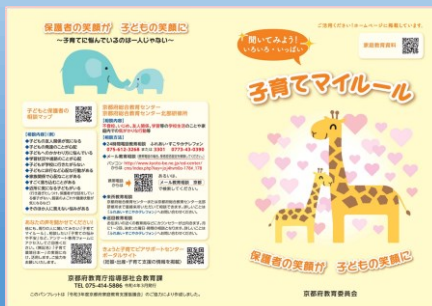
子育てマイルール