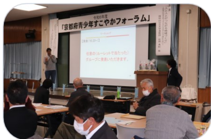
参加者① 思いをひとつ言