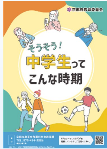
そうそう!中学生ってこんな時期