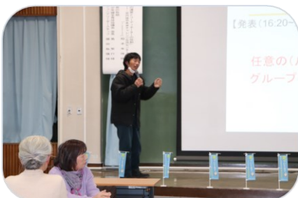
参加者② 思いをひとつ言