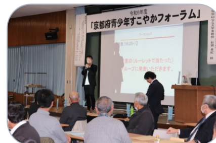
参加者③ 思いをひとつ言