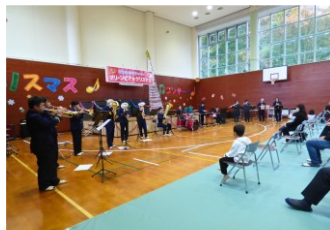
海上保安学校 音楽隊

また、マリーンピアカレーや、クレープ、鉄板焼きの販売も行い、約160名の来場者のみなさんと共に会場は大いに盛り上がりました。