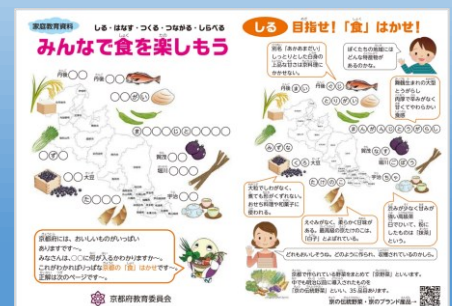
みんなで食を楽しもう