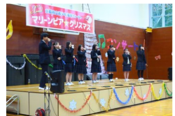
宮津天橋高等学校 加悦谷学舎合唱部

■問合せ先 京都府立青少年海洋センター(マリーンピア) 〒626-0068 宮津市字田井 382 電話 0772-22-0501