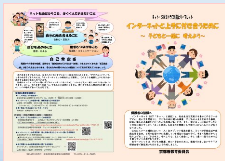
インターネットと上手に付き合うために