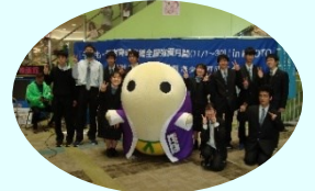
京都府広報監 まゆまる

11月の秋のこどもまんなか月間に併せて、京都府の青少年の問題行動の防止や非行対策及び社会環境浄化など、青少年健全育成推進のための街頭啓発活動を府内青少年関係団体や青少年育成市町村民会議、中学生、高校生の皆さんや京都府広報監「まゆまる」と一緒に街頭啓発活動を実施しました。