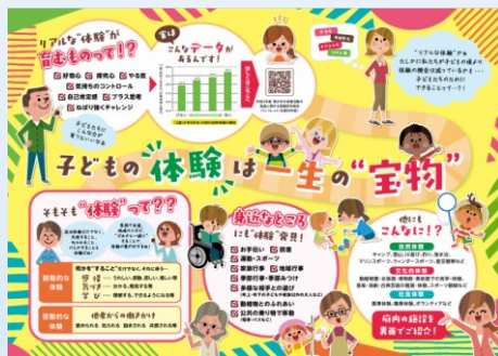
これからの子どもたち