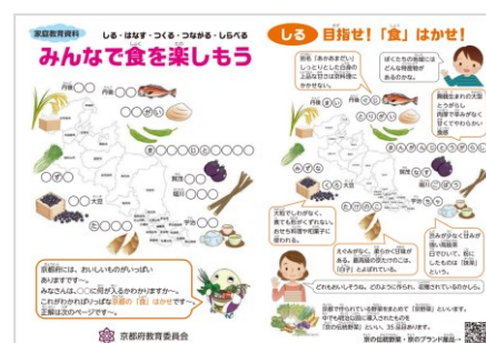
■みんなで食を楽しもう