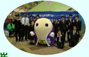
京都府広報監 まゆまる

11 月の秋のこどもまんなか月間に併せて、京都府の青少年の問題行動の防止や非行対策及び社会環境浄化など、青少年健全育成推進のための街頭啓発活動を府内青少年関係団体や青少年育成市町村民会議、中学生、高校生の皆さんや京都府広報監「まゆまる」と一緒に街頭啓発活動を実施しました。