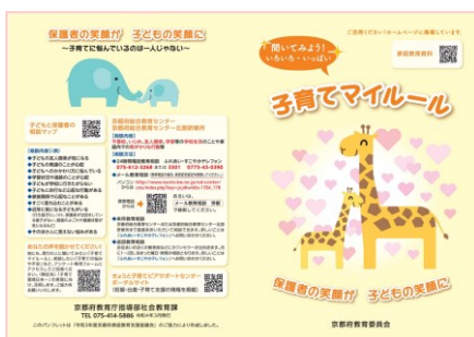
■子育てマイルール