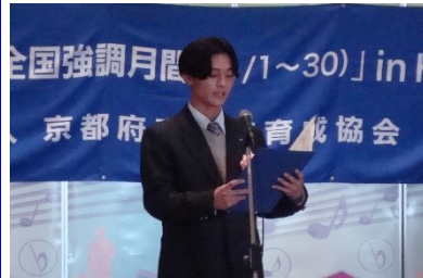
(高校生メッセージ)

初めに、今回このような機会を与えて下さりありがとうございました。啓発活動に参加させていただいたことで、普段の生活ではあまり意識して考えない問題や課題について考えることができました。私のメッセージで少しでも意識が変わってくれと嬉しいなと思います。