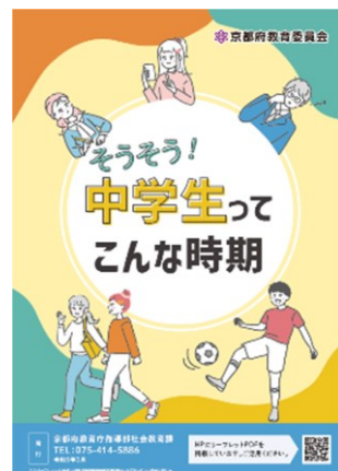
■そうそう!中学生ってこんな時期