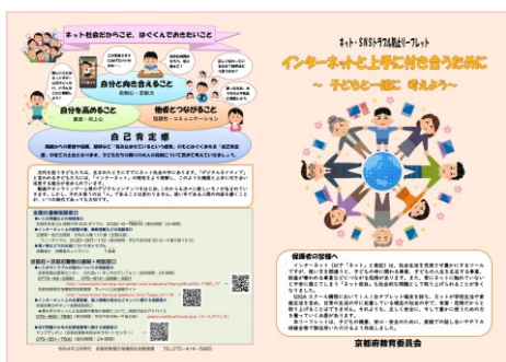
■インターネットと上手に付き合うために