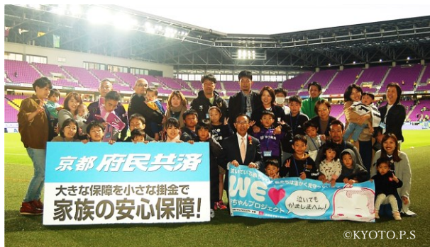
(サンガイイベント)

府内の商店街や子育て環境日本一推進会議に参画いただいている JR 西日本や京都市交通局など、多くの企業・団体のご協力をいただき、公共交通機関や大規模施設など、多くの方々が通過・滞在する公共的な場所でステッカー配付や広告の掲出に取り組んでいます。