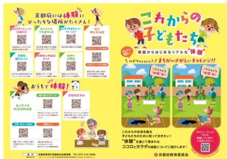
■これからの子どもたち