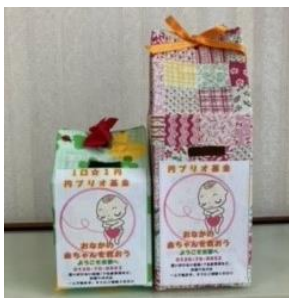
手作りの円ブリオ基金箱